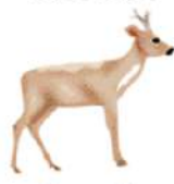
Capriolo Capreolus capreolus